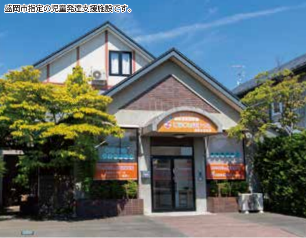
盛岡市指定の児童発達支援施設です。